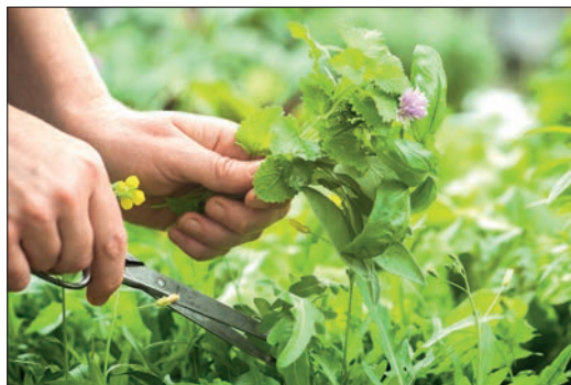
Respect de la cueillette

L'infrastructure de notre laboratoire est optimisée pour observer une qualité irréprochable tout au long de la chaîne de fabrication et une logistique sans faille.