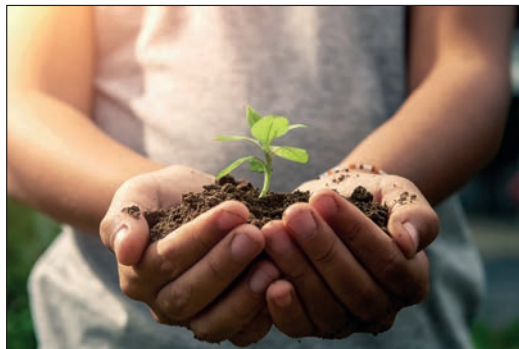
Respect de la plante