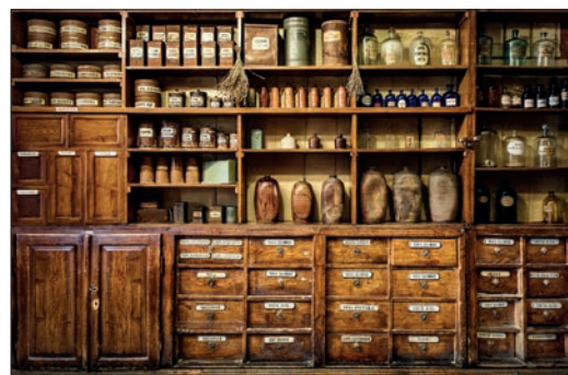
Respect de la tradition